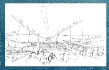
con il mare a vista